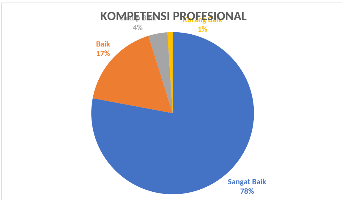
Gambar 2. Kompetensi Profesional