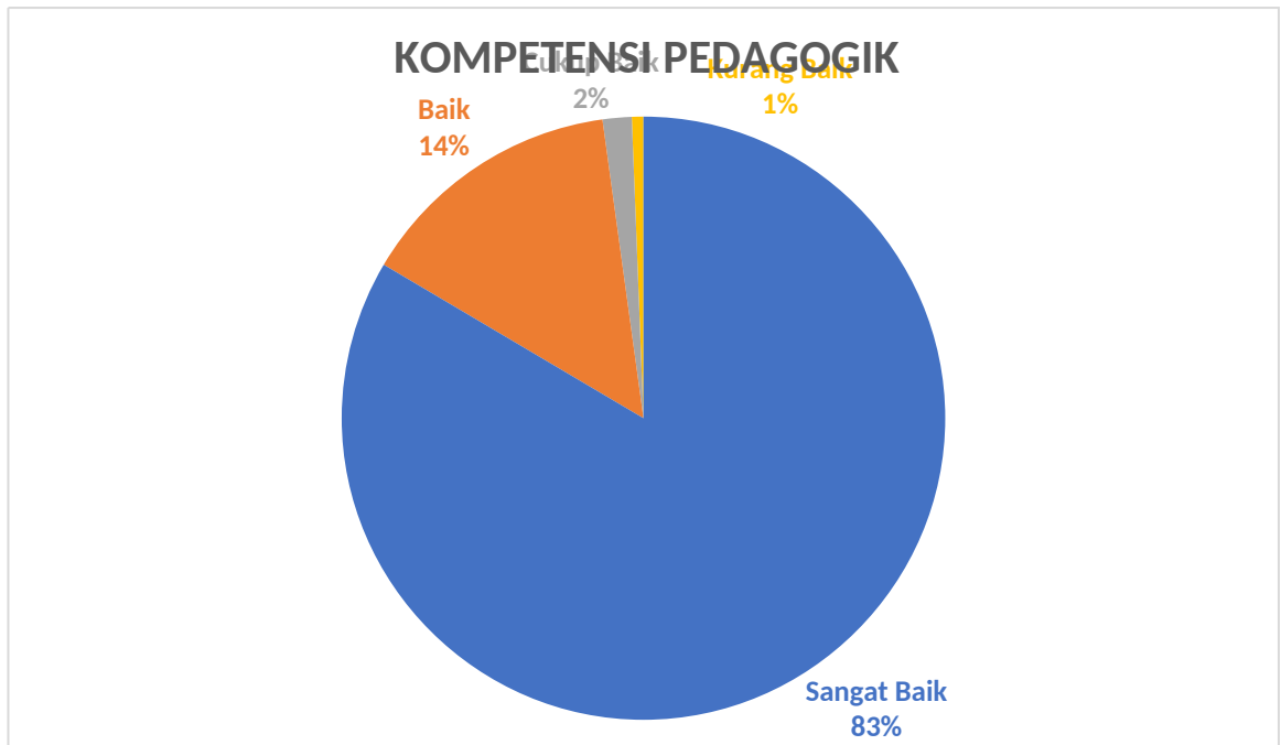
Gambar 1. Kompetensi Pedagogik