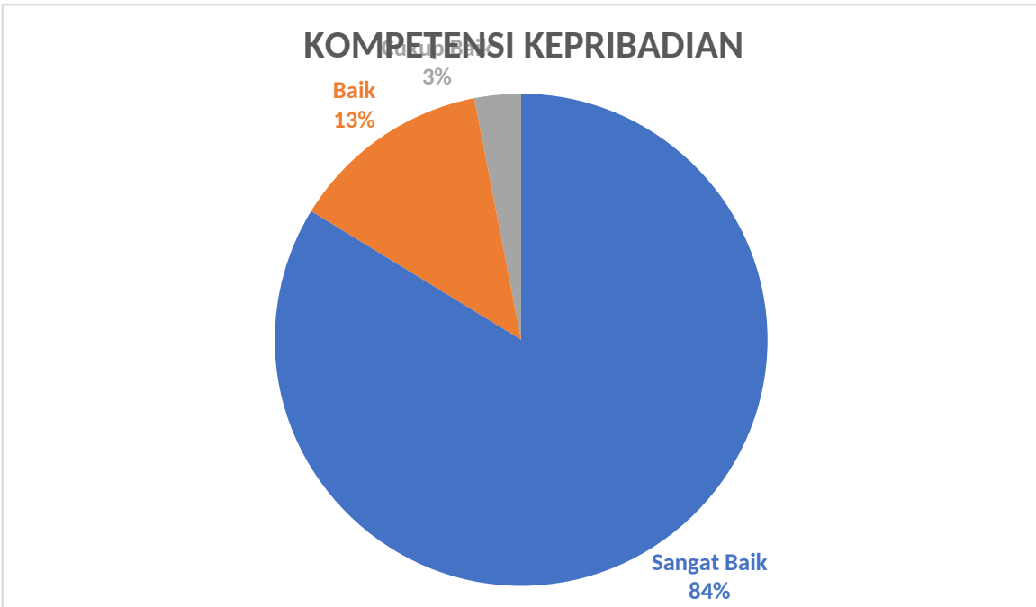
Gambar 3. Kompetensi Kepribadian