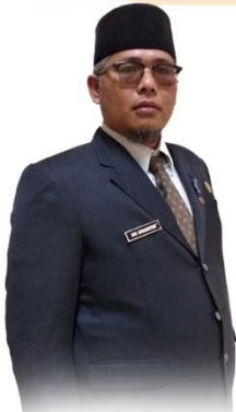
KEPALA SUB BAGIAN AKADEMIK DAN KEMAHASISWAAN